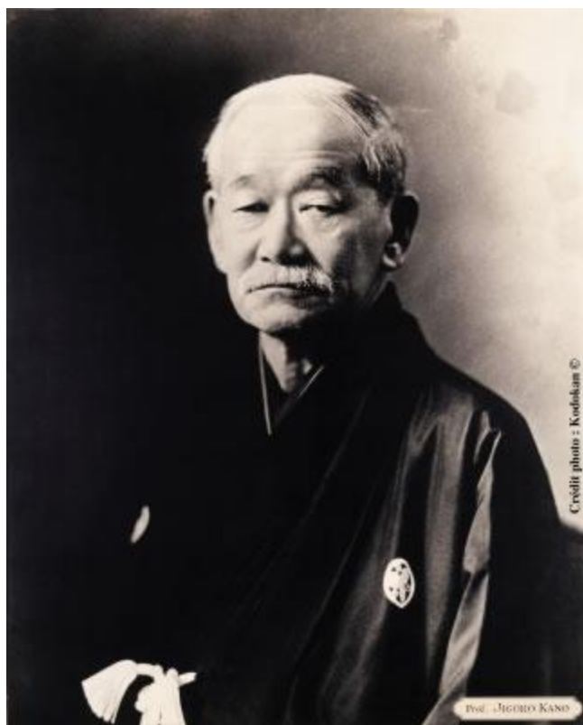
Jigoro Kano – ustanovitelj juda